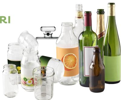
Tous les emballages en verre